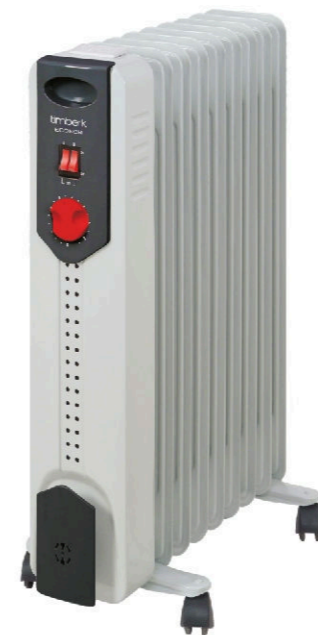
TOR 21... AC

Руководство по эксплуатации Instruction manual