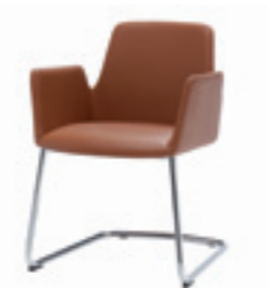
Cantilever base Pie de patin Pietement luge