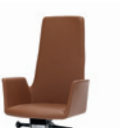
Swivel or tilt aluminium base Base giratoria o basculante de aluminio Giratoire ou basculant avec base aluminium