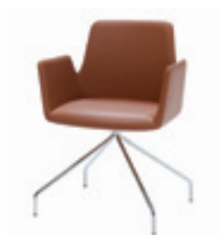
Trestle swivel base Base giratoria piramidal Base giratoire pyramidale