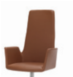
Flat central base Base central plana Pietement axe central