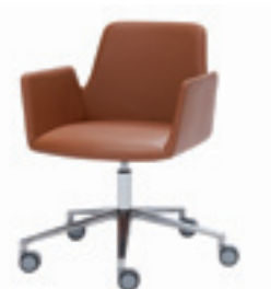
Swivel or tilt aluminium base Base giratoria o basculante de aluminio Giratoire ou basculant avec base aluminium