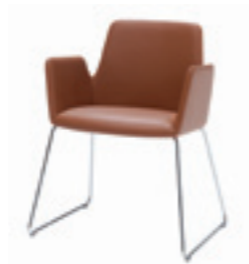
Rod sled base Pie de varilla Pietement en tige d'acier