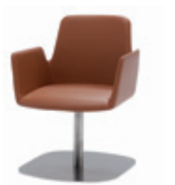
Flat central base Base central plana Pietement axe central