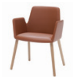
4 oak legs 4 patas de roble 4 pieds en bois