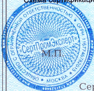
Схема сертификации: 2с