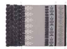
Tumbuctú Neutra. Neutral