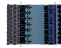
Tumbuctú Colores. Colour