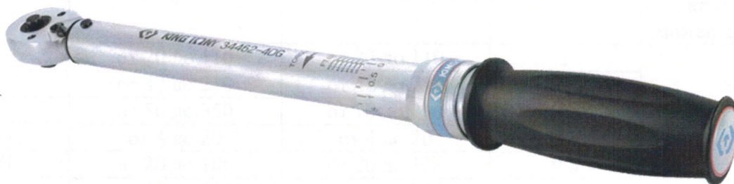
Рисунок 2 - Общий вид ключей модификаций 34262-1DG, 34362-2DG, 34462-1DG, 34462-2DG, 34462-4DG