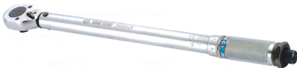
Рисунок 1 - Общий вид ключей модификаций 34323-2A, 34423-1A, 34423-2A

Общий вид ключей представлен на рисунке 1-4.