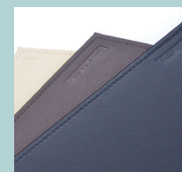
Кожаные настольные коврики