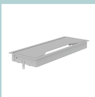
Металлическая крышка для проводов: 317x119 мм, Н=27 мм