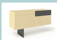
Стационарная тумба слева