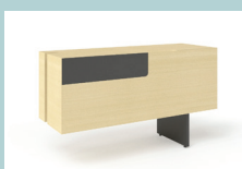
Стационарная тумба справа