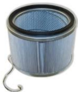
HEPA-Фильтр тонкой очистки