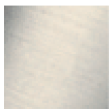
платина матовая 11 285 811-06