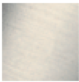
платина матовая 11 285 811-06