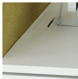
Столешница с вырезом для крышки и подключения проводов