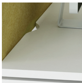
Столешница с дугообразным вырезом для подключения проводов