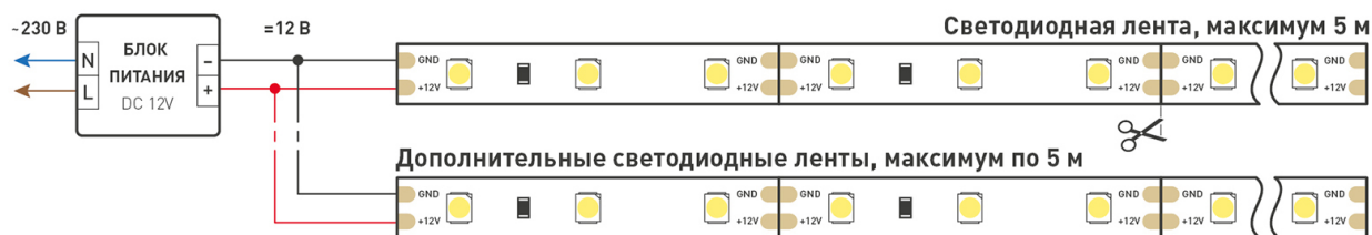
Схема 1. Подключение нескольких светодиодных лент с одной стороны.

Максимальная длина подключения ленты – 5 м (1 катушка).