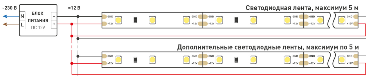
Схема 2. Подключение нескольких светодиодных лент с двух сторон.

Рекомендуется использовать для обеспечения равномерного свечения ленты по всей длине.