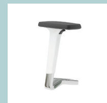
2D подлокотники из белого пластика