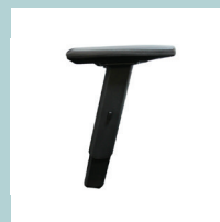
2D регулируемые подлокотники с мягкими ПУ накладками