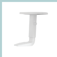
Регулируемые по высоте белые пластиковые подлокотники