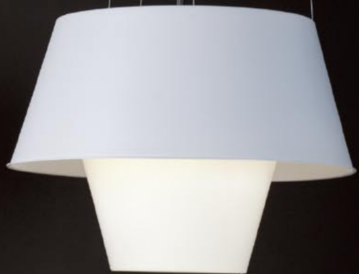
Tanuki Pe Info · p 246

Продажа дизайнерской мебели, светильников, посуды и аксессуаров по всей России