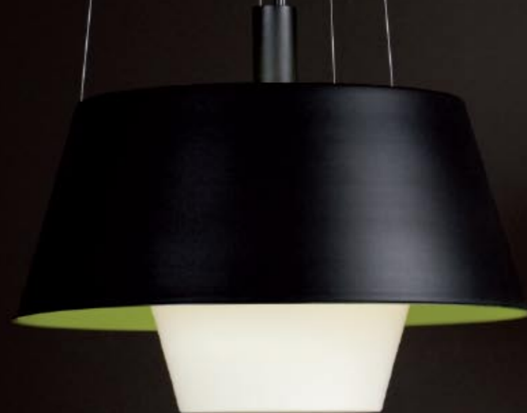
Tanuki Pe Info · p 246