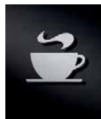
P3701 – 92 x 85 mm