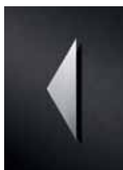
P3501 110 x 30 mm