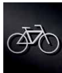
P3401 – 84x150 mm