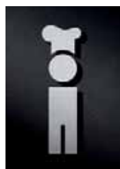
P2301 – 135 x 45 mm