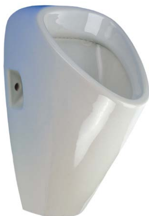
SLP 19 - GOLEM