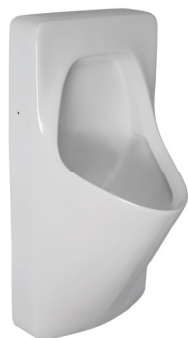
SLP 20 - ANTERO