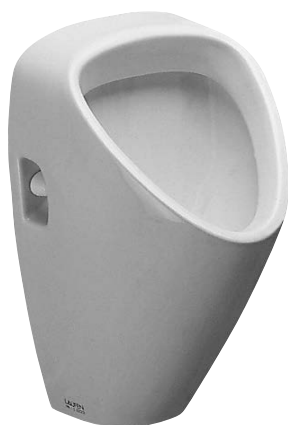
SLP 23 - CAPRINO