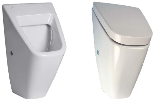
SLP 12 - VILA БЕЗ КРЫШКИ