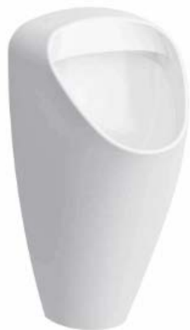
SLP 49 - CAPRINO PLUS RIMLESS