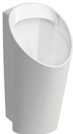
SLP 59 - LEMA