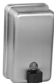
SLZN 39 95390 Нержавеющий дозатор жидкого мыла