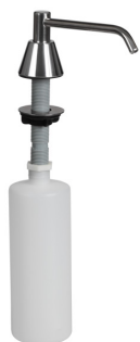
SLZN 17 95170 Встроенный дозатор жидкого мыла