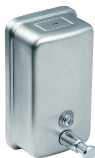
SLZN 06 95060 Нержавеющий дозатор жидкого мыла