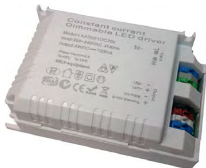
ARJ-LK65320-DIM ARJ-LK45500-DIM ARJ-LK43700-DIM

Диммируемые, Вход 0-10 В С корректором коэффициента мощности