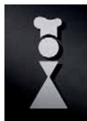
P2401 – 135 x 55 mm