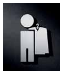
P1301 – 110x65 mm