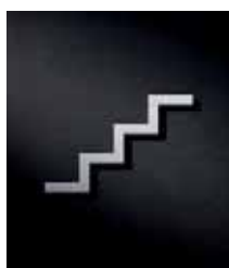
P3201 – 79x117 mm