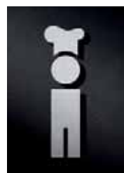
P2301 – 135 x 45 mm