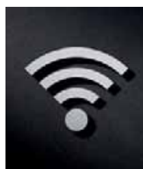
P4101 – 112x91 mm

Ideal zur Kombination mit anderen Piktogrammen