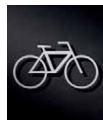
P3401 – 84x150 mm