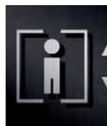
P3301 – 94x130 mm