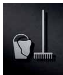
P3801 – 110x96 mm