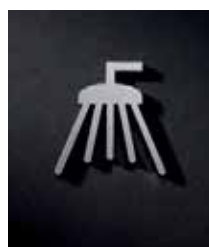
P2201 – 55x50 mm