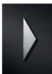
P3501 gedreht 110 x 30 mm

Ideal zur Kombination mit anderen Piktogrammen