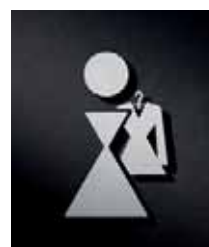
P1401 – 110x69 mm