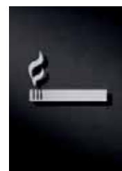
P3001 – 67 x 100 mm