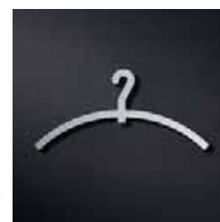
P1901 – 44x90 mm