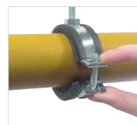
2. Закрывать хомут / нажать на винт