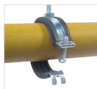
1. Поместить трубу в хомут