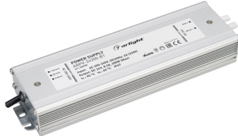
ARPV-12200-B1 ARPV-24200-B1 ARPV-24300-B1