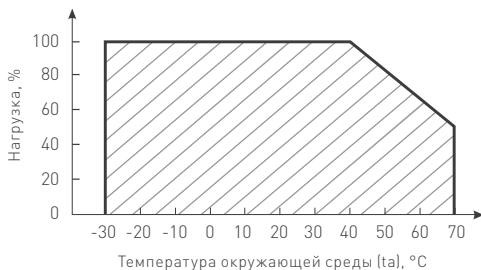
Рис. 2. Максимальная допустимая нагрузка, % от мощности источника.