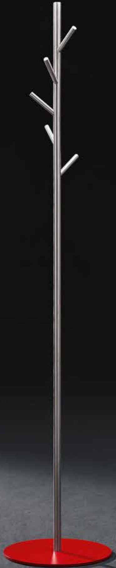
STANDGARDEROBE RAMUS GSTR-BPR MIT ROTER BODENPLATTE