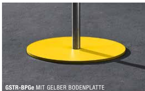
GSTR-BPGe MIT GELBER BODENPLATTE