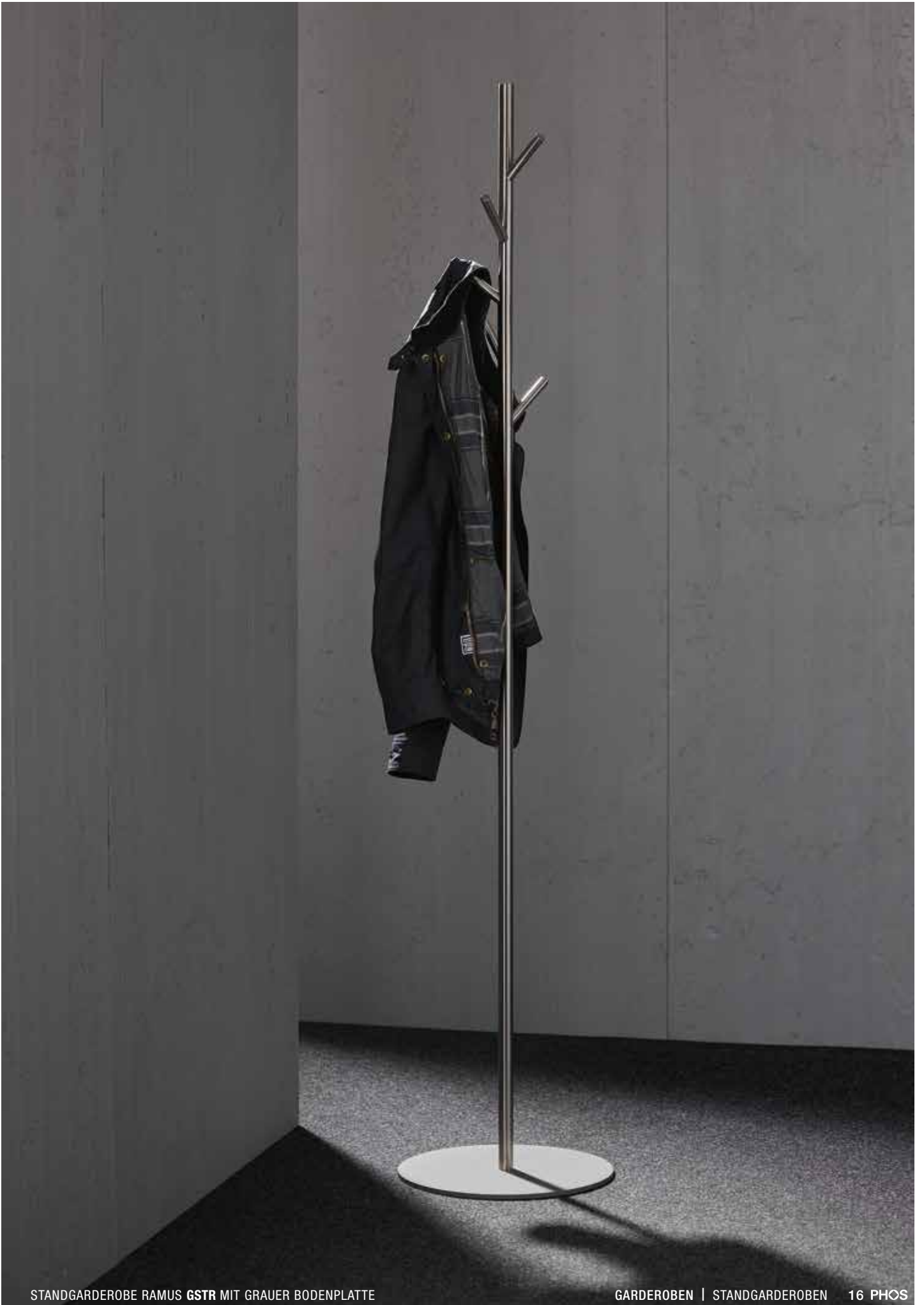
STANDGARDEROBE RAMUS GSTR MIT GRAUER BODENPLATTE