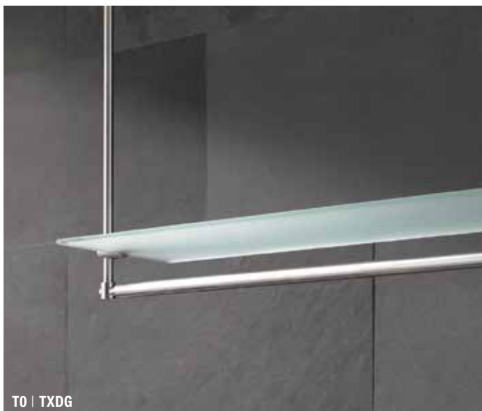
T0 | TXDG