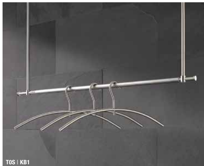
TOS | KB1