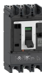
Темно-серый с белым.

Выключатель ComPacT NSX для сетей пер.тока