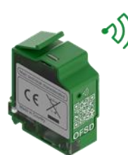
Новый беспроводной вспомогательный контакт

Все описанные выше новые устройства: рычаг/рукоятка управления, беспроводной контакт будут доступны для продажи не ранее середины марта 2022 года.