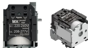
Обновленные расцепители напряжения MN/MX