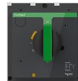
Обновленная поворотная рукоятка управления

В гамме ComPacT NSXm/NSX появляется новый беспроводной дополнительный контакт OF/SD зеленого цвета. Беспроводная технология сокращает общее время монтажа и подключения: быстрый ввод в эксплуатацию и мгновенная передача информации о состоянии аппарата.