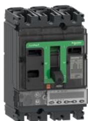
Темно-серый с зеленым.

Новая гамма выключателей ComPacT отличается от действующей обновленным дизайном: темно-серый цвет корпуса и полупрозрачная передняя крышка, все расцепители выключателя представлены в темном цвете, а надписи на панели обозначены текстом белого цвета. Цветовое решение передней панели аппарата информирует пользователей о применении выключателя в сетях переменного тока или постоянного тока: