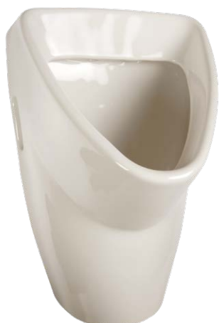
SLP 31 - LIVO