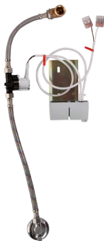
Схема включения и монтажа