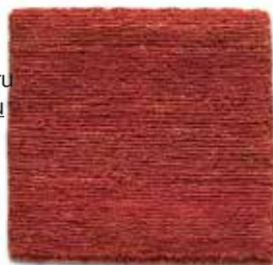
Terracota / Terracotta