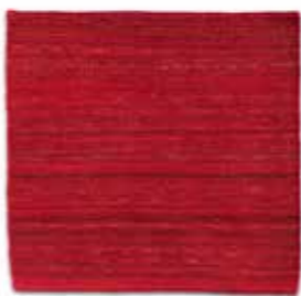
Grana / Deep red