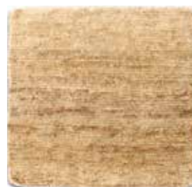
Natural / Natural