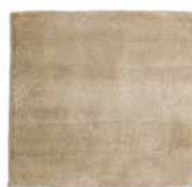
Natural / Natural