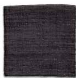
Negro / Black