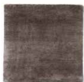
Gris pardo / Taupe