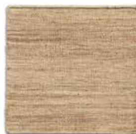
Natural / Natural