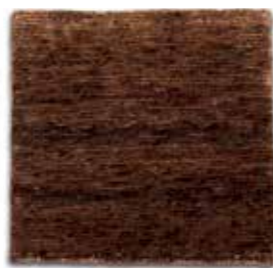
Marrón / Brown