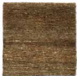
Caqui / Khaki