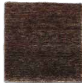
Negro / Black