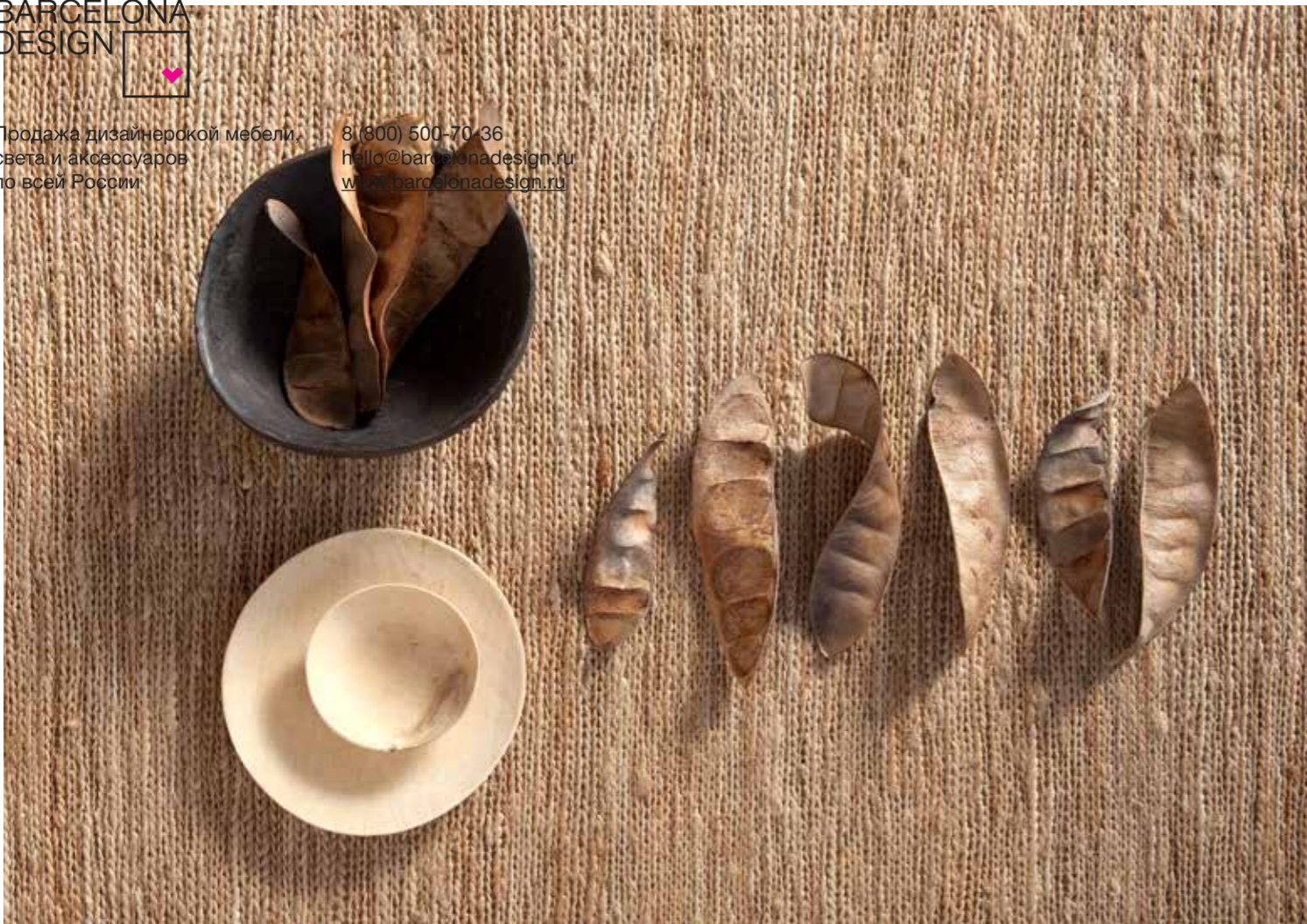
Natural / Natural