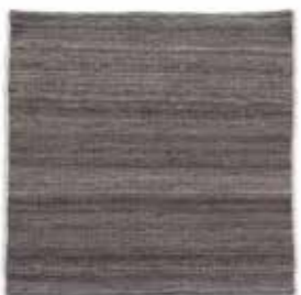
Gris / Grey