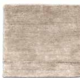
Natural / Natural