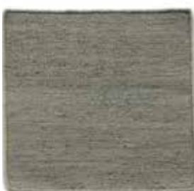
Gris verdoso / Greenish grey