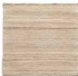
Natural / Natural