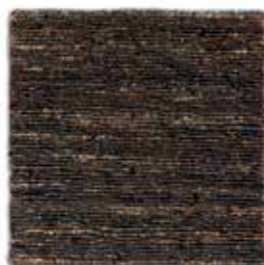
Negro / Black