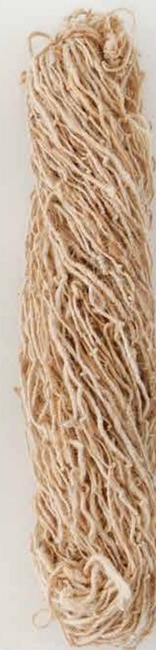
Lana afgana / Afghan wool