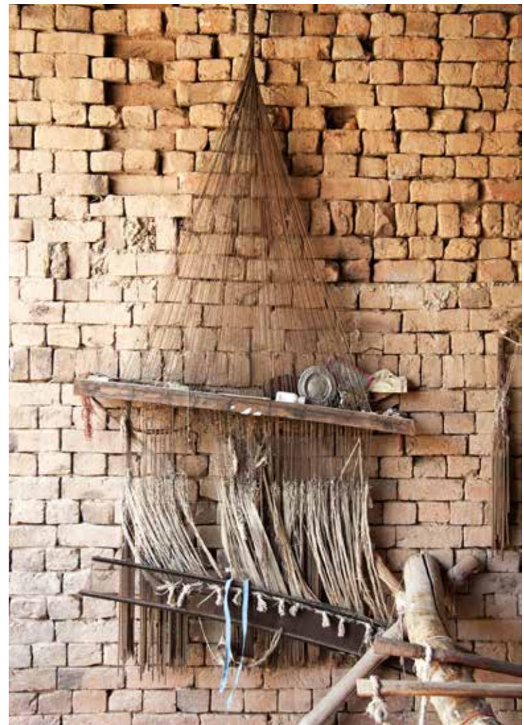
Technique Hand-woven sumak