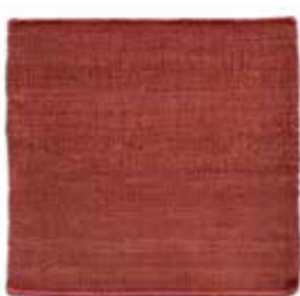
Granate / Garnet