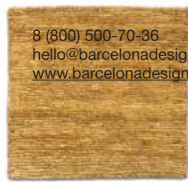
Ocre / Ocher