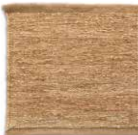
Natural / Natural