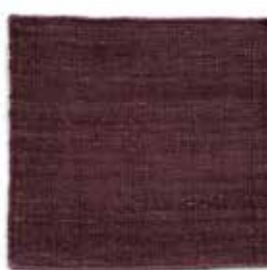
Marrón / Brown