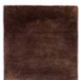
Chocolate / Chocolate

Todas nuestras alfombras están hechas a mano, por lo que se pueden apreciar variaciones de color entre ellas y las muestras del catálogo debido al proceso artesanal. Esto las hace aún más únicas. Estas variaciones de color pueden ser debidas a las características propias de la fibra vegetal o a otros efectos.