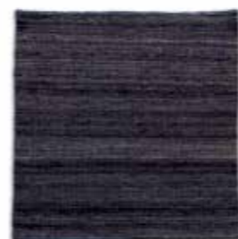
Negro / Black