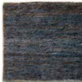
Azul / Blue