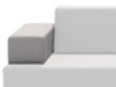
TET0001BD - TET0001BI