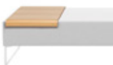
TET045BJD - TET045BJI