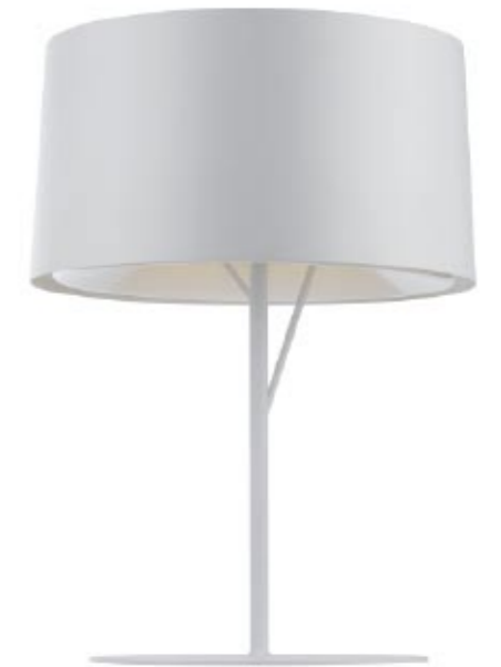
Eda m Info · p 249