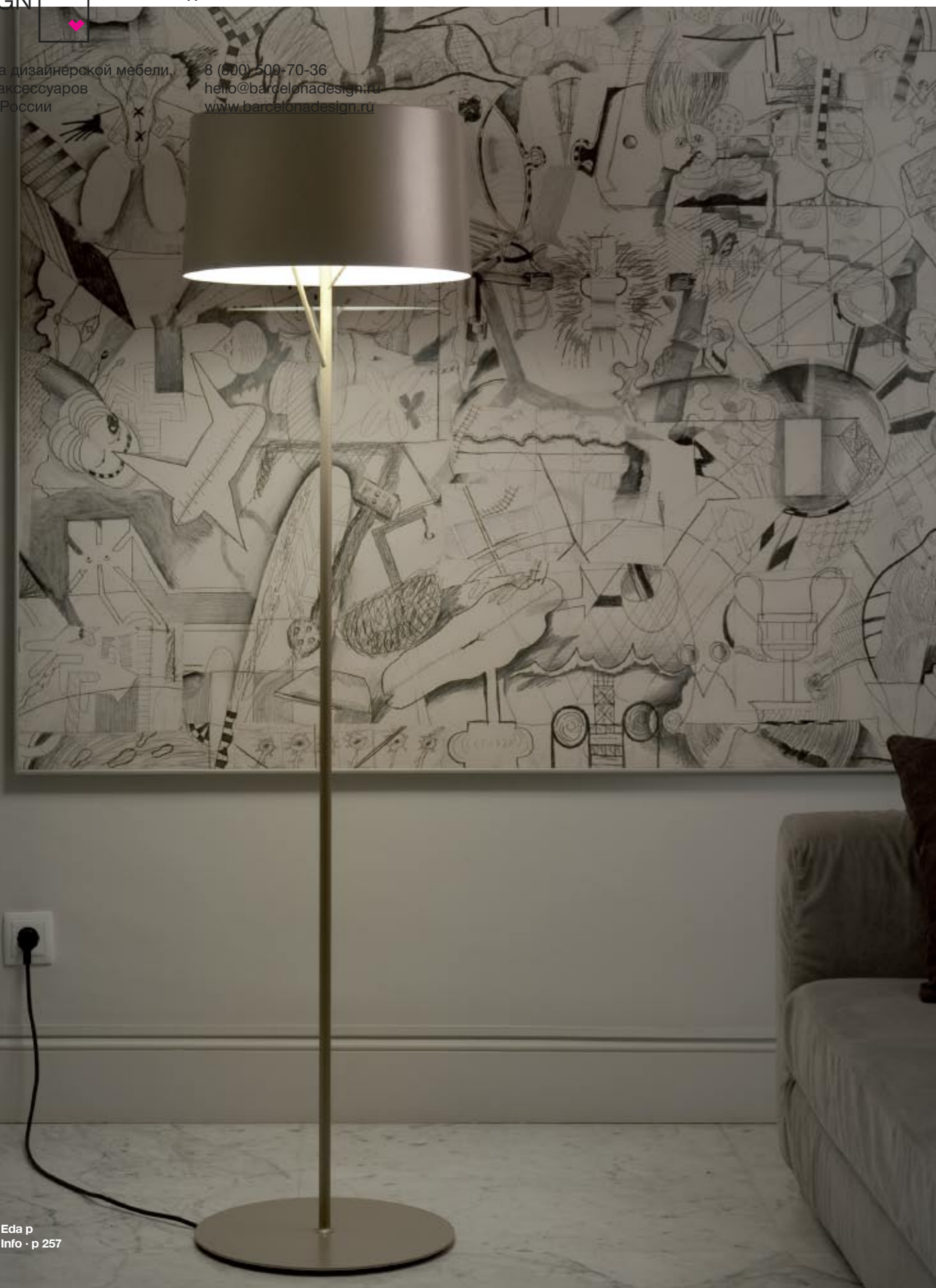
Eda p Info · p 257

8 (800) 500-70-36 hello@barcelonadesign.ru www.barcelonadesign.ru