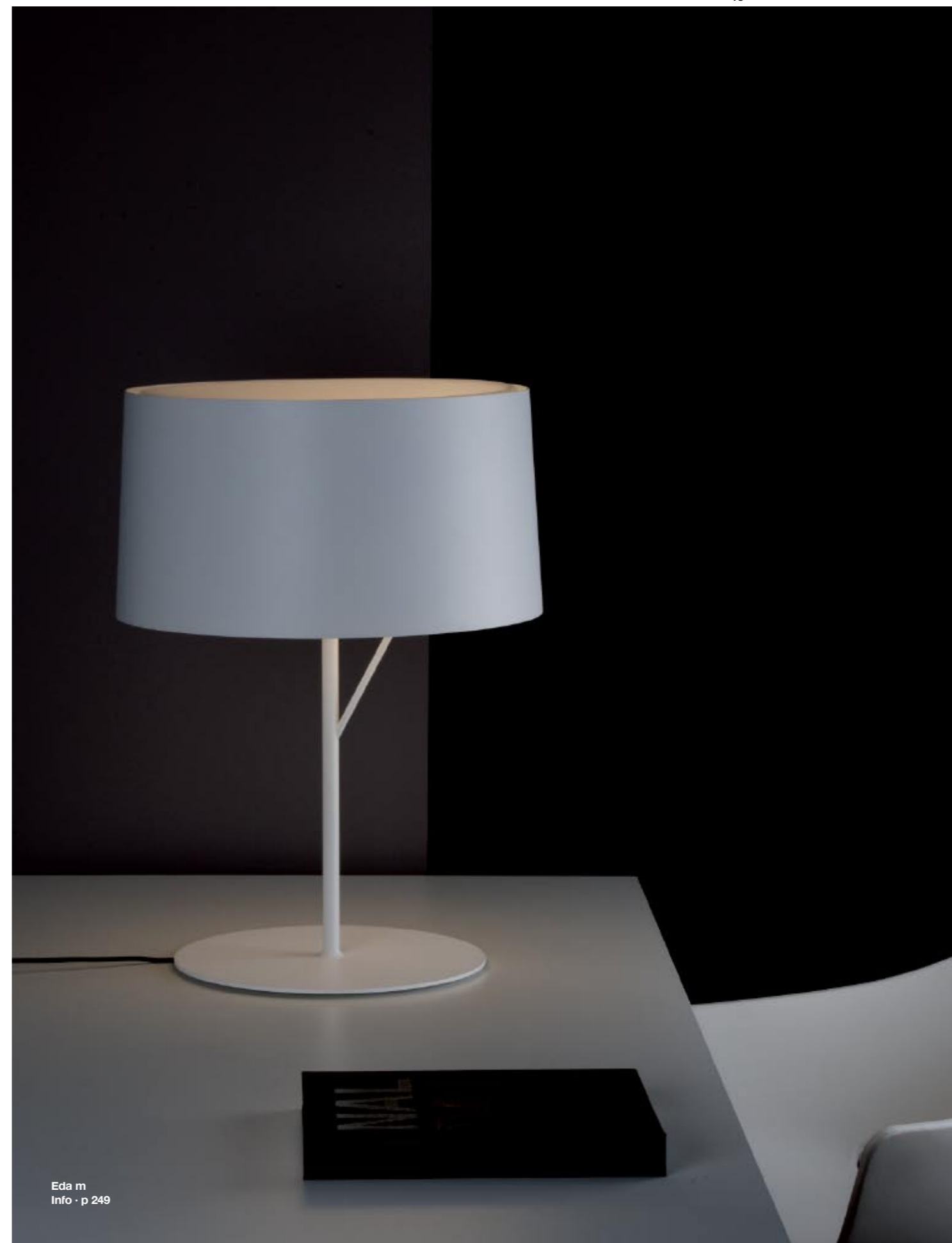
Eda m Info · p 249