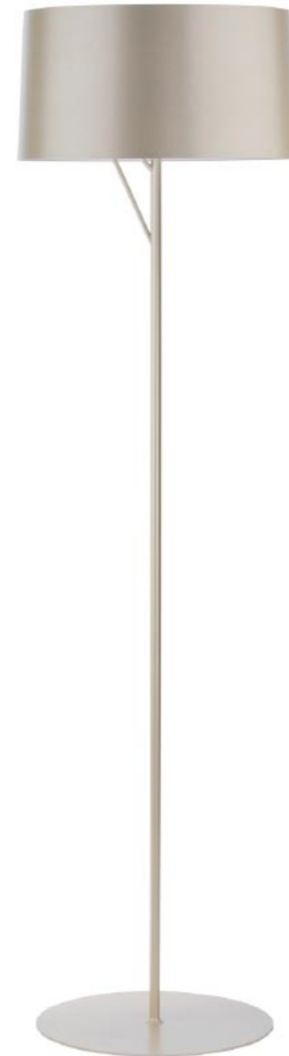
Eda p Info · p 257

Famiglia di lampade composta da tre modelli, da terra, sospesa e applique. Struttura in acciaio finitura bianca, grigio grafite e champagne. Diffusore superiore in metacrilato opalino satinato e diffusore inferiore in metacrilato ghiaccio.