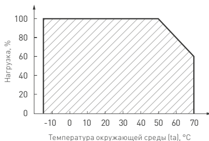
Рис. 2. Максимальная допустимая нагрузка, % от мощности источника.