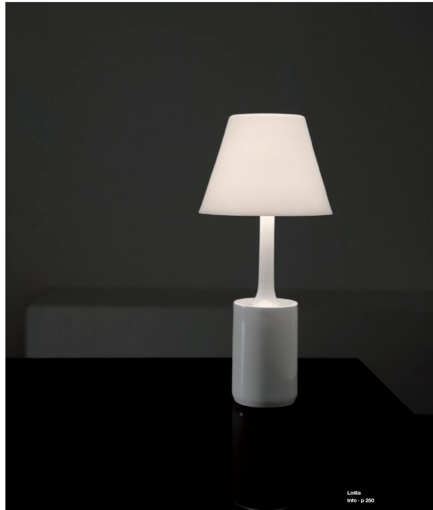
Lolita Info · p 250