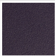
Purple Blue Cod. 1D