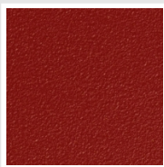
Flame Red Cod. 7D