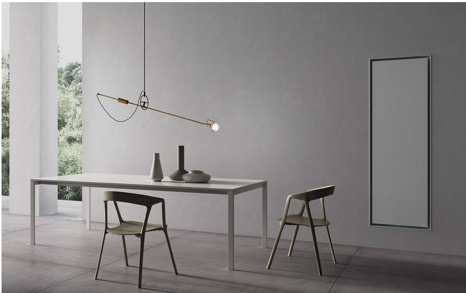
Face Zero Air, altezza 1800 mm, larghezza 600 mm, Bianco Perla, con NOW

FACE ZERO_Air, il primo radiatore raso muro di Irsap. Un prodotto dallo spiccato valore estetico che garantisce complanarità con le pareti, integrandosi e fondendosi in ambienti di grande valenza architettonica. Il modello Face Zero_Air è la versione ad incasso con sistema integrato di ventilazione che consente alti rendimenti ed alta efficienza energetica. La gestione del comfort è garantita dall'integrazione dell'unità modulante NOW, presente di serie in tutte le versioni. Grazie all'ampia superficie radiante e alla forma della cornice che permette la perfetta diffusione dell'aria calda, i radiatori Face Zero_Air sono ideali per il funzionamento di impianti a bassa temperatura. L'apertura a libro con chiusura a calamita, sicura e facile, garantisce una veloce e corretta pulizia e un pratico accesso a tutte le parti funzionali del corpo scaldante. Il radiatore può essere integrato direttamente ai "Sistemi Now" ed al controllo remoto tramite smartphone. Face Zero_Air è disponibile nelle nuance di colore Irsap (Classic e Special) e nelle raffinate finiture esclusive in acciaio inox proposte dallo Studio Citterio.