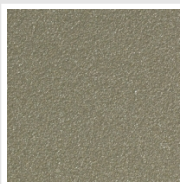
Sunstone Cod. 2D