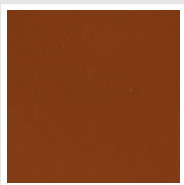
Marrone Ruggine - RAL 8004 Cod. E1