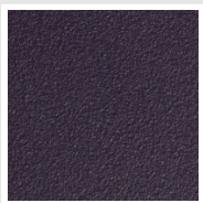
Purple Blue Cod. 1D