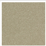
Quartz 2 Cod. 2C