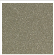
Sunstone Cod. 2D