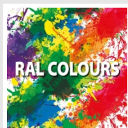
Altri colori RAL (previa fattibilità) Cod. ALTRIRAL

I colori rappresentati in questa cartella non sono da considerarsi impegnativi. I diversi processi tecnologici di verniciatura ed i materiali utilizzati per la realizzazione possono non avere una perfetta corrispondenza cromatica con il prodotto consegnato. L'azienda Irsap si riserva la facoltà di apportare in qualsiasi momento tutte le modifiche necessarie per il miglioramento del prodotto.