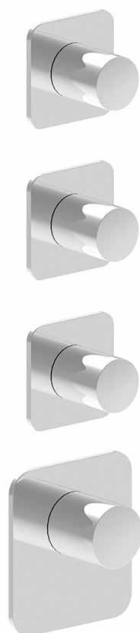
MONTAGE HORIZONTAL ET VERTICAL HORIZONTAL OR VERTICAL ASSEMBLY