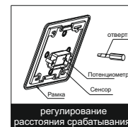
регулирование расстояния срабатывания

Устройство отрегулировано на расстояние использования 55-65 см. В случае необходимости расстояние можно отрегулировать. Снимите лицевую панель и с помощью отвертки поверните потенциометр по часовой стрелке для увеличения расстояния и против часовой стрелке для уменьшения.