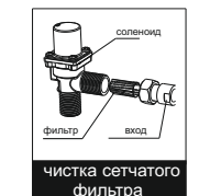
чистка сетчатого фильтра

Изготовителем установлен следующий алгоритм работы устройства: однократная промывка (5 с ~ 8 секунд) в то время как пользователь покидает зону обнаружения.