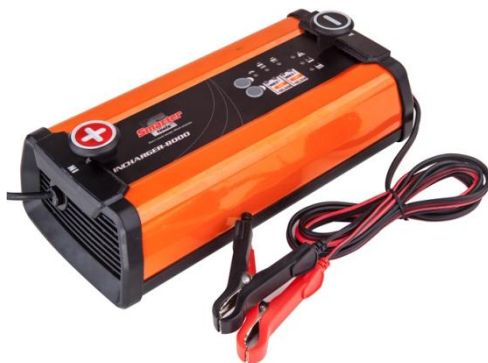
Рис.1 Общий вид

Работа устройства основана на принципе фазового сдвига напряжения (инверсии). Переменный ток преобразуется в постоянный с помощью высокочастотных диодов и инвертора на IGBT-транзисторах. Плата управления осуществляет связь между выходным и входным каскадами устройства и тем самым регулирует параметры зарядного тока в зависимости от состояния батареи. Кнопки-селекторы позволяют выбирать необходимый режим зарядки, а светодиоды отражают выбранный режим.