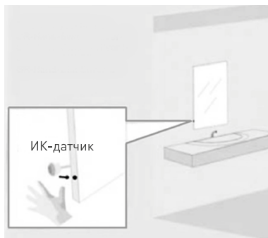
Вариант установки SR-Hand-Switch-Silver-R SR-Hand-Switch-Silver-S SR-Hand-DIM Silver-R SR-Hand-DIM Silver-S

3.3. Подключите светодиодную ленту или другой светодиодный источник света к выходным проводам LED- и LED+ диммера, соблюдая полярность.