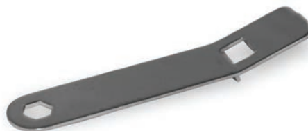
Специальный ключ необходим для работ с триммерной головкой