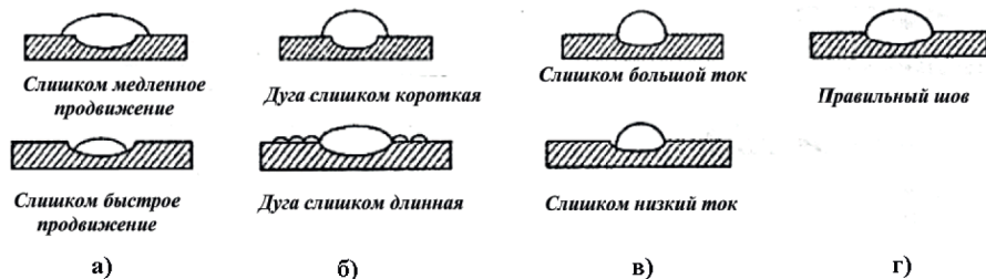
Рис. 3. Типы сварочных швов.

7.7. При правильном выборе скорости сварки и силы тока шов получается необходимой ширины без деформаций и кратеров, см. рис.3г.