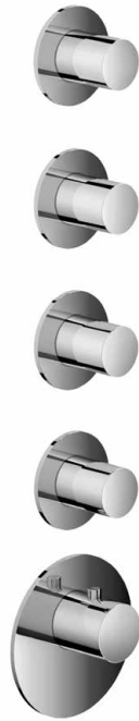
MONTAGE HORIZONTAL ET VERTICAL HORIZONTAL OR VERTICAL ASSEMBLY