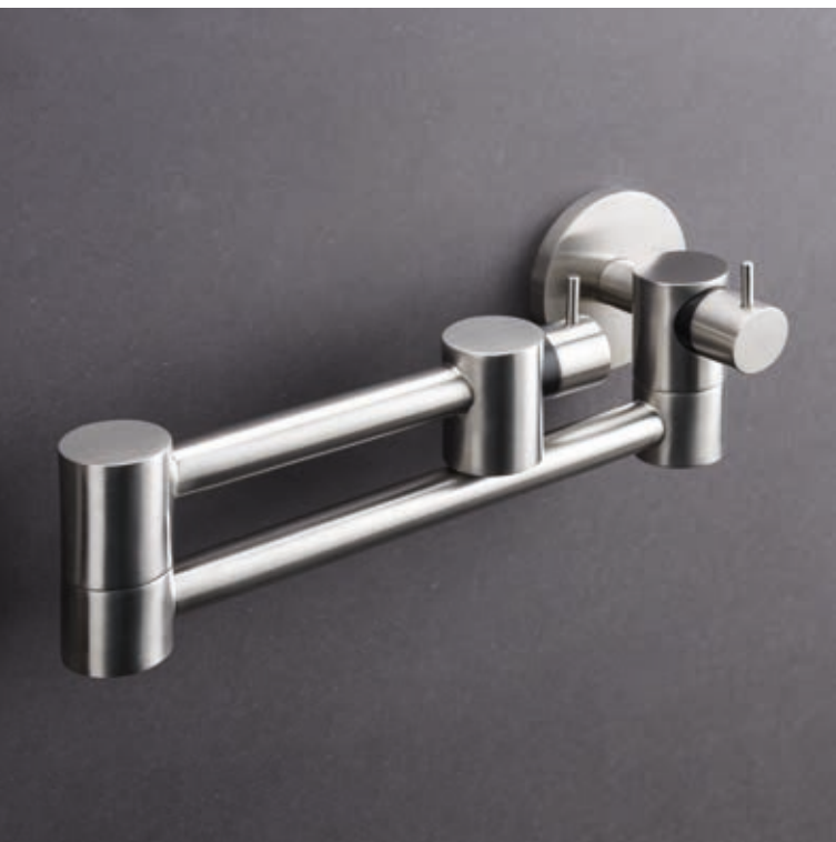
POT FILLER 9600