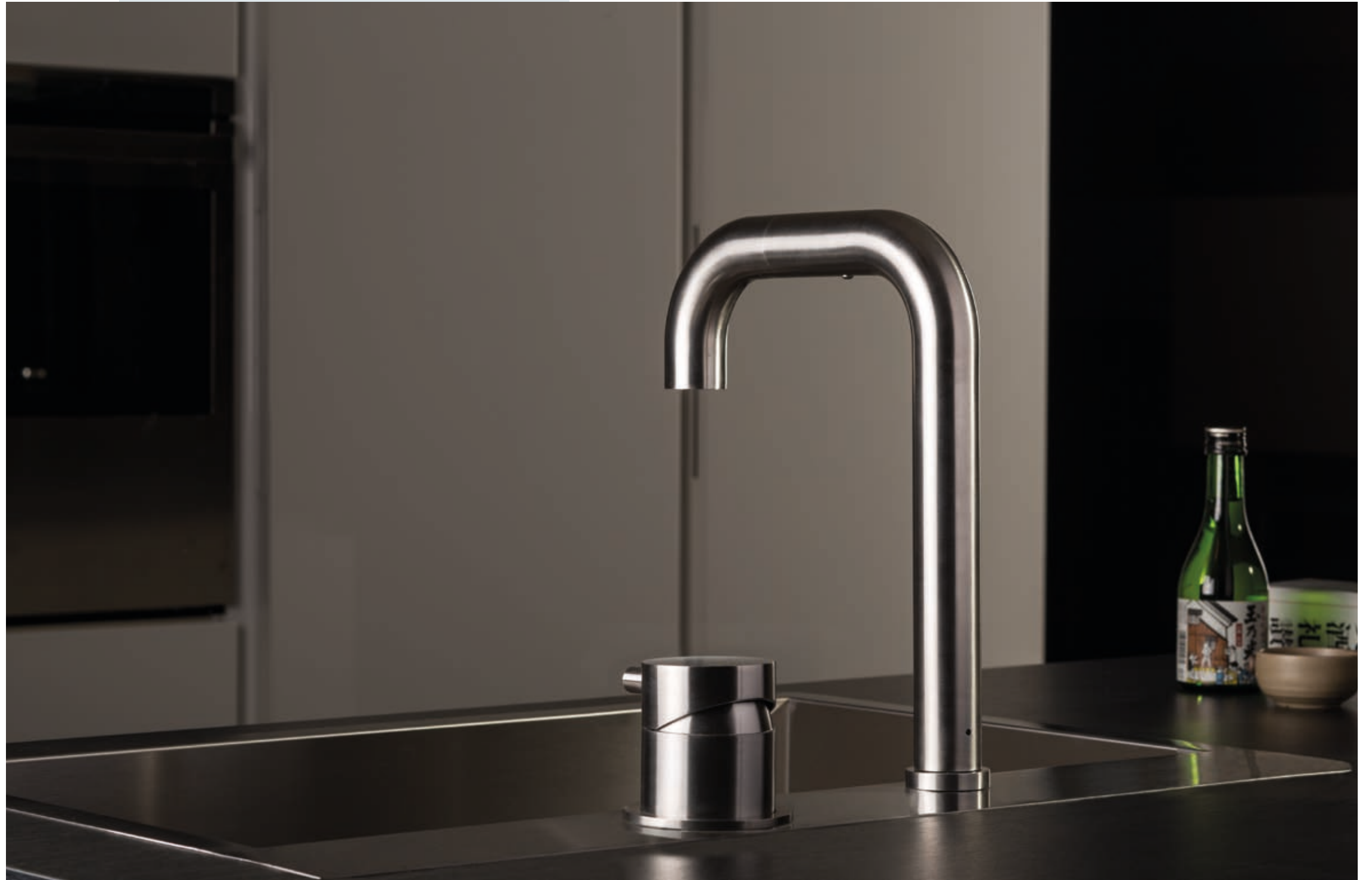
TIDE OVER 94074