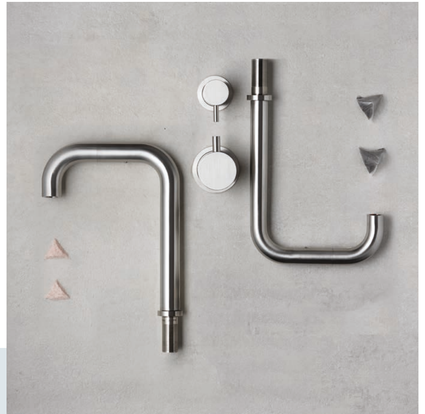
TIDE OVER 94074