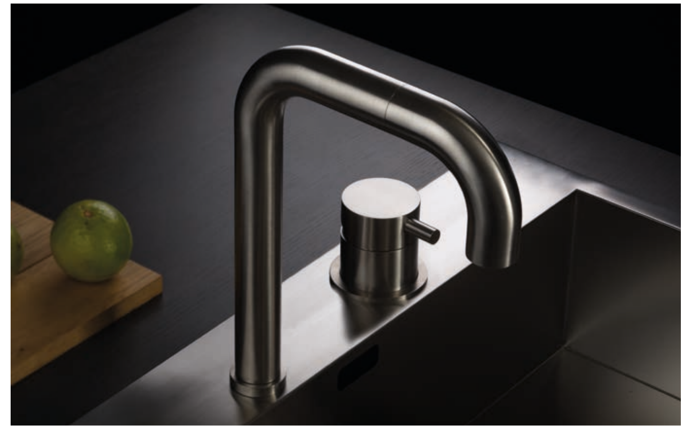
TIDE OVER 94074