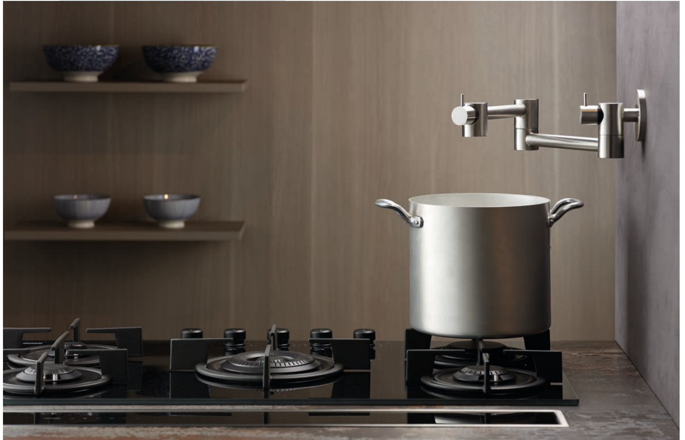
POT FILLER 9600