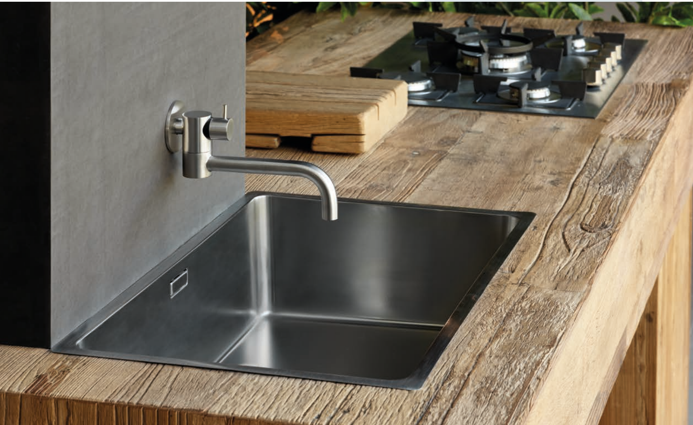
POT FILLER 96111