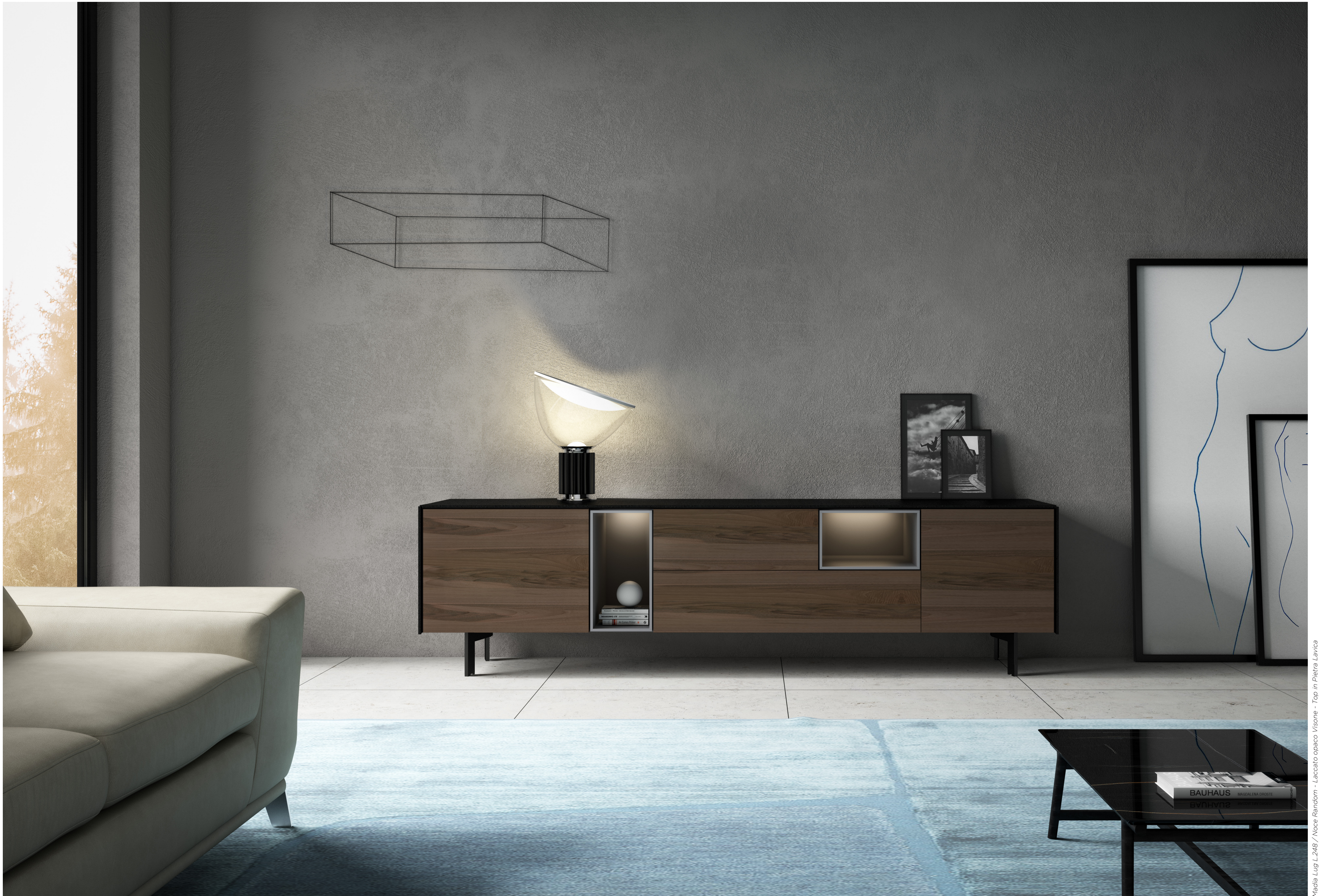
Madia Lug L.248 / Noce Random - Laccato opaco Visone - Top in Pietra Lavica