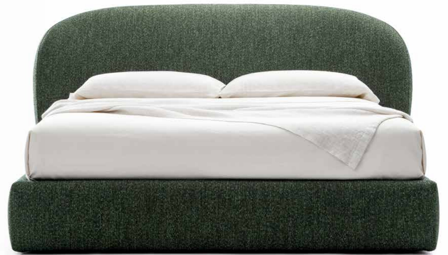
Guest bed, coffee table, Caillou table lamp.