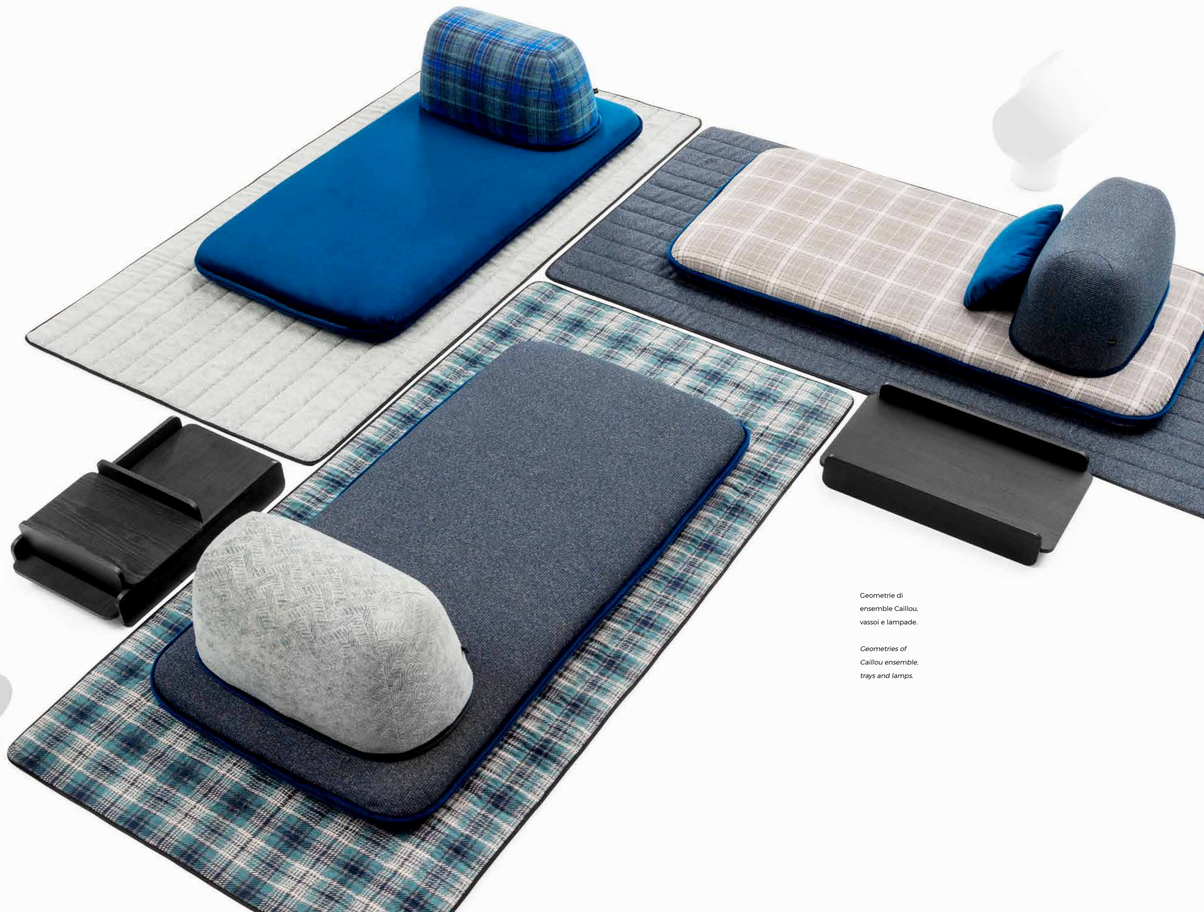
Geometrie di ensemble Caillou, vassoi e lampade.