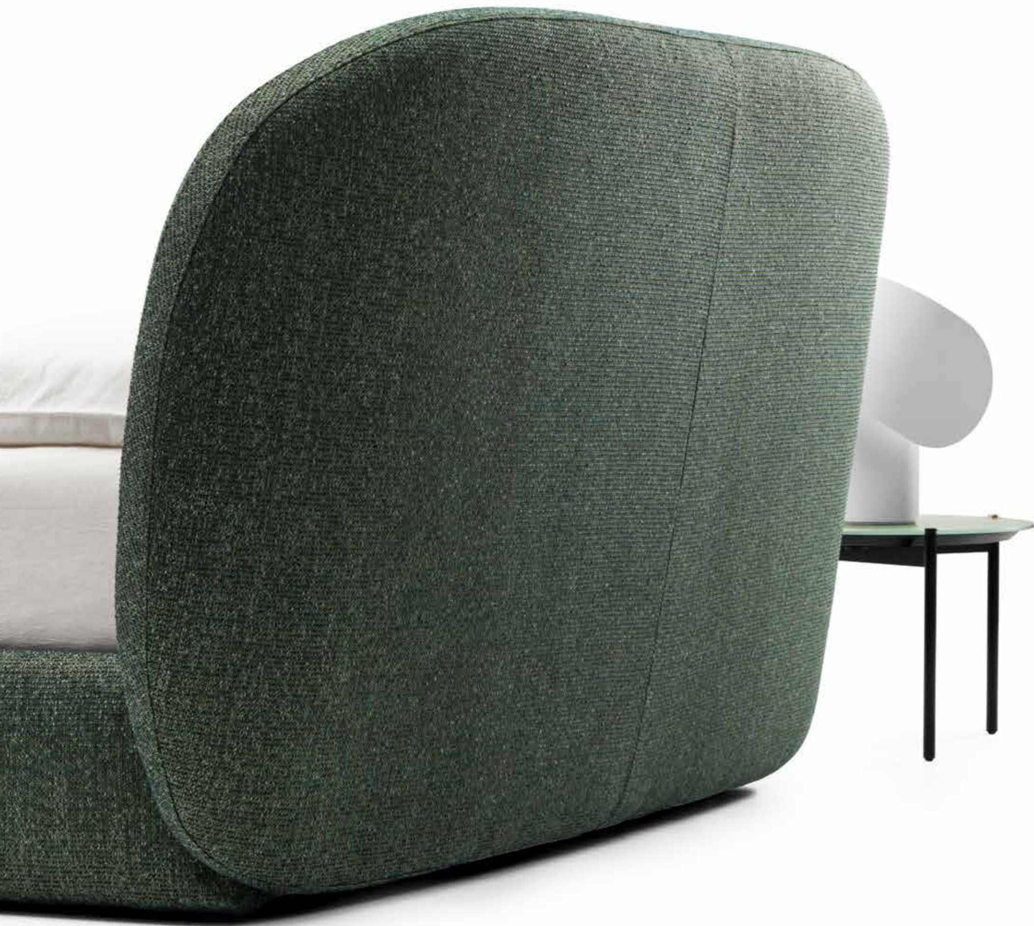
Letto Guest, coffee table, lampada da tavolo Caillou.