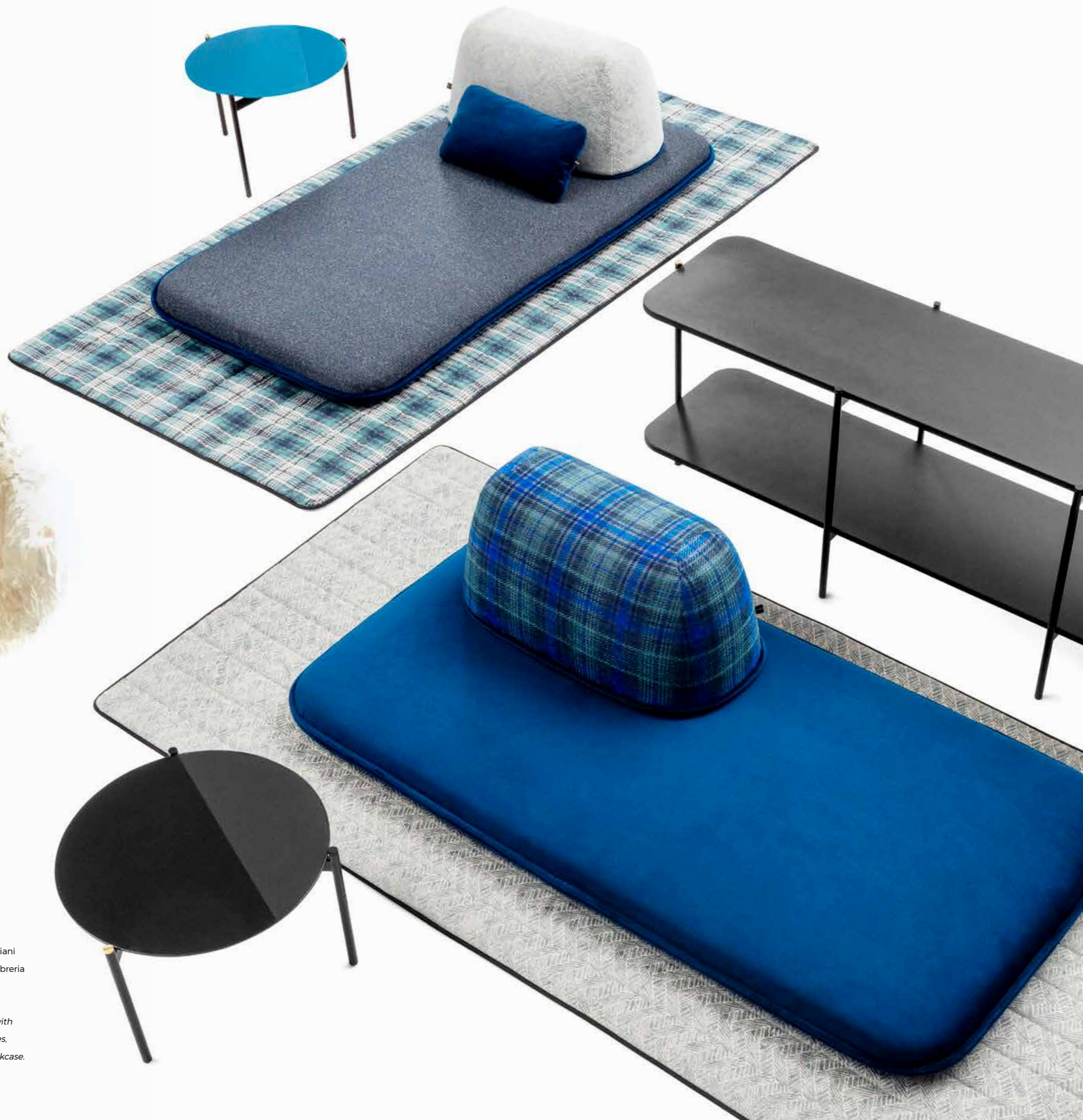
Ensemble Caillou, tavolini con ripiani incastonati in strutture tubolari, libreria bassa laccata nero opaco.